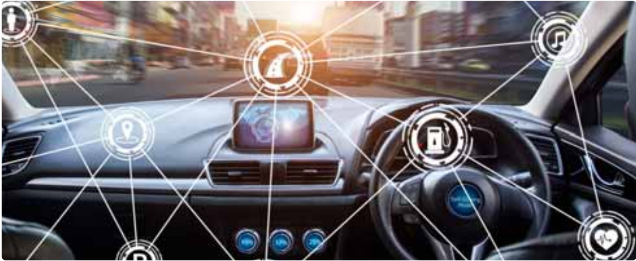
Autonomes Fahren und Elektromobilität stellen die Unternehmen vor Herausforderungen in der Weiterbildung.

Die befragten Unternehmen nannten eine Vielzahl von Themen und Herausforderungen, mit denen sie derzeit konfrontiert sind: Neben der umfassenden Herausforderung der Digitalisierung, die für 37 % der Unternehmen relevant ist, wurde der Fachkräftemangel am häufigsten – von insgesamt 58 % der Befragten – genannt. Dies führt dazu, dass einige Unternehmen nun versuchen, Fachkräfte auf internationaler Ebene zu rekrutieren. Es besteht insbesondere ein Bedarf an Fachkräften in den Bereichen Elektromobilität, autonomes Fahren und digitaler Integration. Die fortschreitende Entwick-