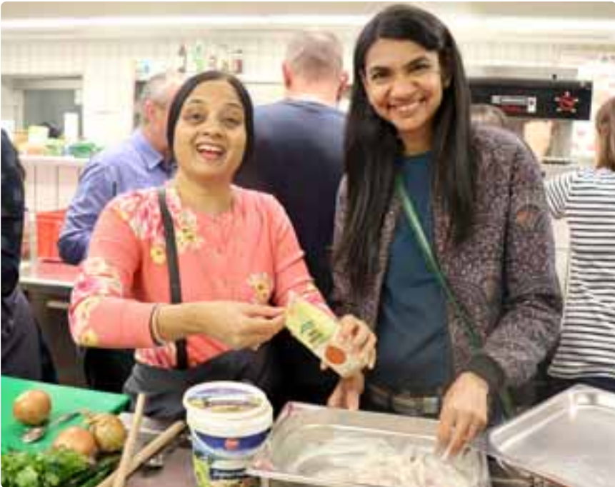
Vom Best-Practice-Austausch bis zum International Cooking: Die International Partnership Week hatte für die Gäste wieder einiges zu bieten.

Der Start der Partnership Week war ein Best Practice-Austausch der Teilnehmer*innen. Bei einer Study Abroad Fair hatten die Studierenden der DHBW Ravensburg die Gelegenheit, die Hochschulen kennenzulernen und auch ein Besuch des Technikcampus in Friedrichshafen stand in dieser Woche auf dem Programm. Viel Gelegenheit zum Austausch gab es beim International Cooking genauso wie bei einem Besuch von Schloss Neuschwanstein.