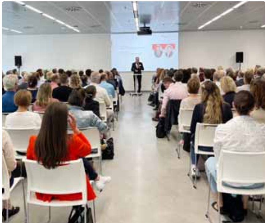
Auftakt zum Forschungstag an der DHBW Stuttgart.

Der DHBW Forschungstag 2023 hat sich mit dem Thema „Nachhaltigkeit gestalten: Gesellschaft, Gesundheit, Technologien und Märkte“ befasst. Er fand dieses Jahr an der Fakultät Technik der DHBW Stuttgart statt.