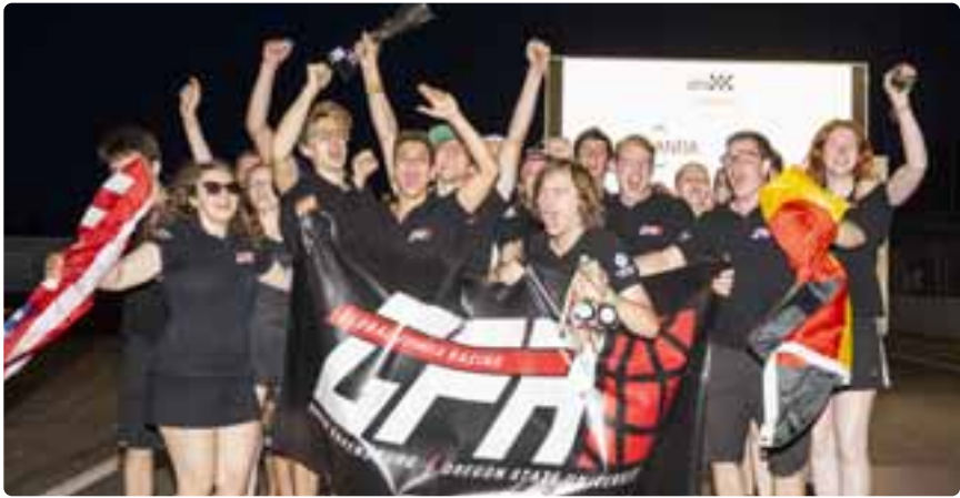
Das GFR-Team freut sich über Platz 2 in Italien.

Die Neuentwicklung startete 2023 dabei mit elektrischem Antrieb und Fahrer bei der FS East (Platz 23) und den Rennen in Michigan (15. Platz) und in Hockenheim (Platz 39). Das zweite Fahrzeug ging in Italien und in Spanien ebenfalls elektrisch aber in der autonomen Klasse an den Start. In Italien gab es dann einen tollen Platz 2. Sehr gut lief es für den Autonomen auch in Spanien mit Platz 5.