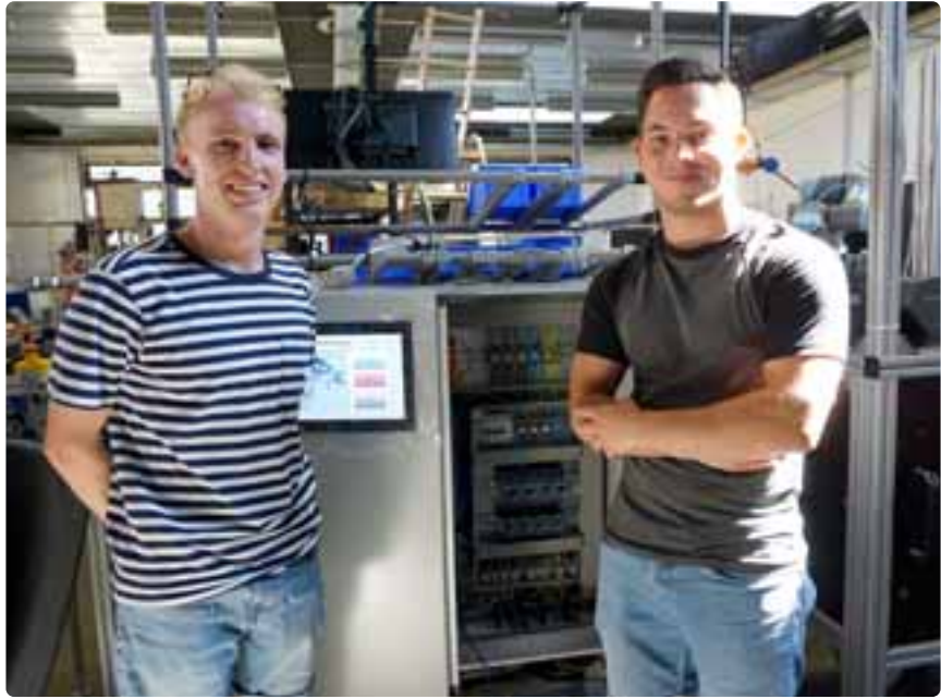
Gut 20 Studierende verschiedener Studiengänge haben an dem Aufbau der smarten Produktion für die Zukunftsfabrik Bodensee mitgearbeitet.