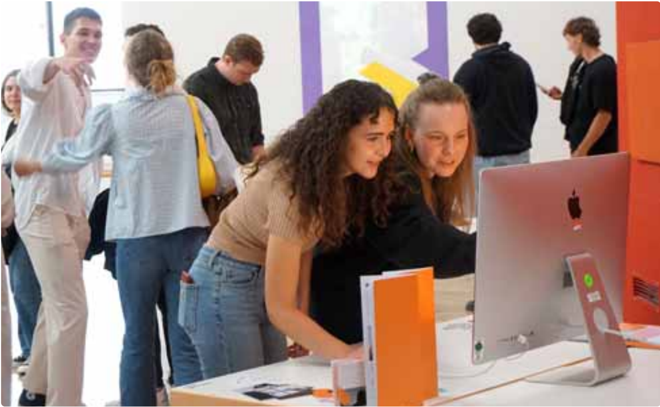
Vor dem Start ins neue Studienjahr inspirierten auch dieses Jahr die Mediendesigner wieder mit ihrer Werkschau.

Der Aufwärtstrend in der Technik hält weiter an. War es 2022 mit 590 Studienanfängern bereits ein Rekordjahrgang, so ist die Zahl in diesem Jahr erneut angestiegen – auf rund 660 Erstsemester. „Die Partnerunternehmen haben derzeit einen enormen Bedarf an Fachkräften, die die technischen Herausforderungen der Zukunft meistern können. Es ist damit auch gleichzeitig für den Campus Friedrichshafen die derzeit größte Herausforderung, diesen Bedarf zu decken. Aktuell bleiben jedes Jahr auch von den Firmen reservierte Studienplätze frei. Dieser Herausforderung stellen wir uns als