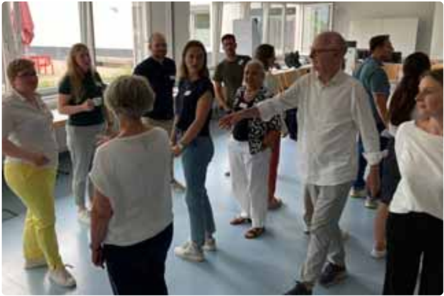
„Partizipation erlebbar machen“ hieß das Motto der 7. Summer University.

Participation ( https://www.school-of-participation.com ) und mit Un-