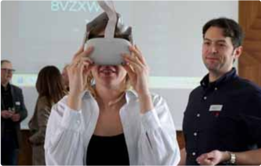
Ein Blick in die Virtual Reality.