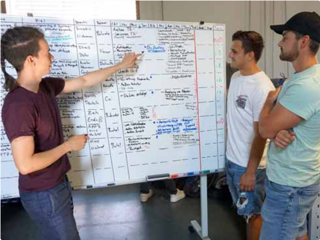
Beim Start of Production der Zukunftsfabrik Bodensee präsentierten die Studierenden ihre Arbeiten.

Gruppe Condition Monitoring für Kooperationsaufbau mit externem Unternehmen