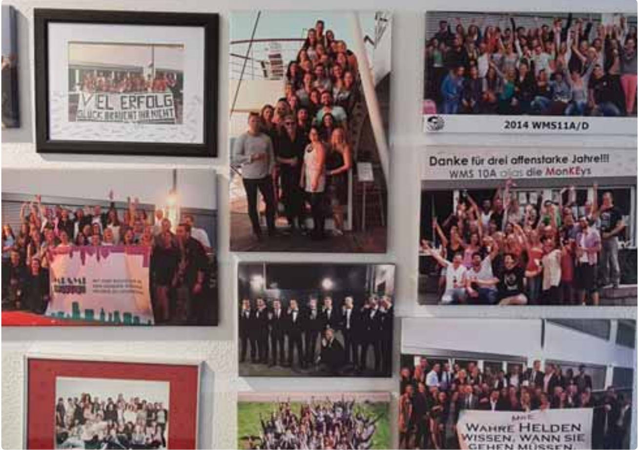
Eine lang angelegte Studie beleuchtet die Erwerbsbiografien von Alumni im Veranstaltungsbereich.

Negative Auswirkung Auszeit Eine aussagekräftige Anzahl von 382 Absolvent*innen der Jahrgänge