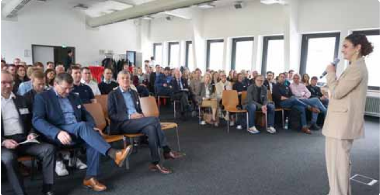
Bei der Jahrestagung des Zentrums für empirische Kommunikationsforschung (ZEK) ging es darum, wie digitale Tools den Unternehmensalltag revolutionieren.

Das Zentrum für empirische Kommunikationsforschung (ZEK) unterstützt und forciert die Forschungsaktivitäten der DHBW Ravensburg in diesem Bereich. Es unterstützt empirische Projekte in Lehre und Forschung. Im Fokus der anwendungs- und transferorientierten Forschung stehen Menschen, Marken und Medien. Eine weitere Aufgabe ist die Bereitstellung von modernem Forschungsequipments. Über die Fachtagungen pflegt das ZEK regelmäßig den fachlichen Dialog.