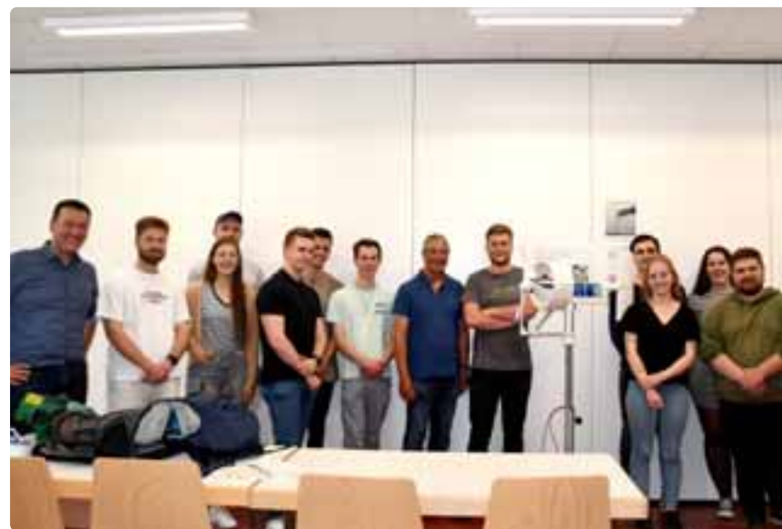
Das Gewinnerteam hat ein Windrad mit verstellbaren Rotoren entwickelt.

Der Förderverein der DHBW Ravensburg zeichnet Studienarbeiten im Maschinenbau aus