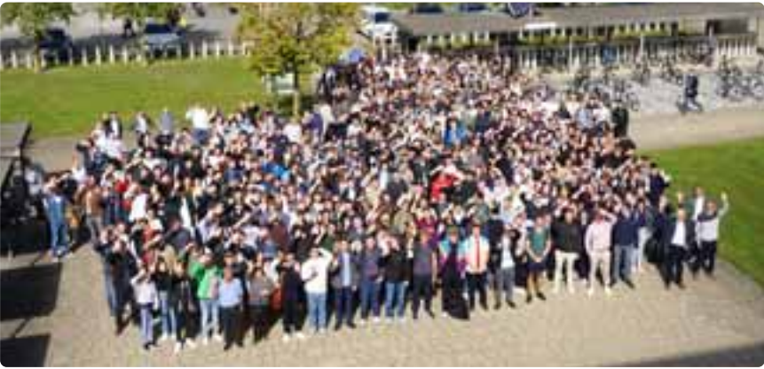
Ein toller Anblick: Am Technikcampus begrüßte die DHBW rund 660 Erstsemester.