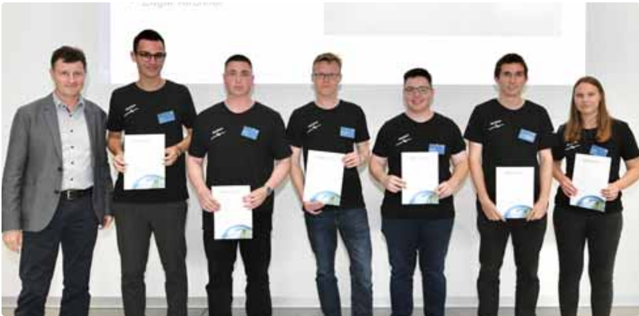
Bei der diesjährigen Design Challenge des Deutschen Zentrums für Luft- und Raumfahrt (DLR) hat sich ein studentisches Team vom Technikampus Friedrichshafen der DHBW Ravensburg Platz 1 geholt.

Das ist den Studierenden im Studiengang Luft- und Raumfahrttechnik der DHBW Ravensburg mit ihrem Konzept „The Sentinel System“ hervorragend und mit Platz 1 prämiert bestens gelungen. Es ermöglicht dem Flugzeug mit hochgestrecktem Flügel eine Flugdauer von 50 Stunden. Angetrieben wird das Luftfahrzeug durch einen 78 Kilowatt starken Kolbenmotor, der die benötigte Leistung für einen Pusher-Propeller im Heck bereitstellt. Die Studierenden legten ein besonderes Augenmerk auf die Navigation des auto-