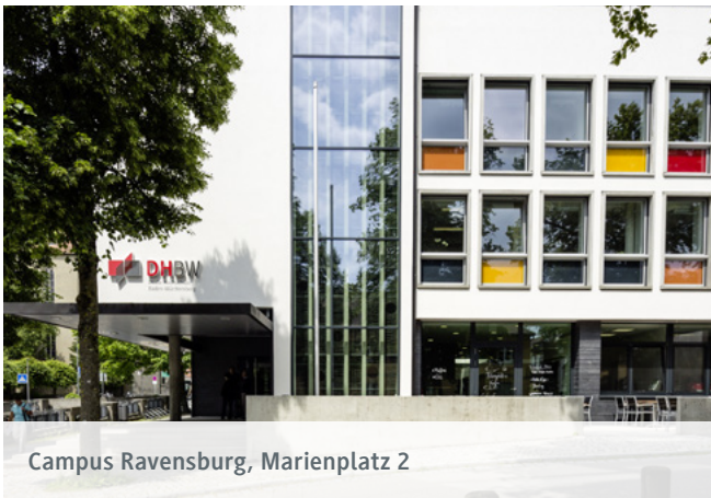
Campus Ravensburg, Marienplatz 2

Weitere Informationen zu den Master-Programmen der DHBW sowie unseren lokalen Kooperations-Mastern unter www.CAS.dhbw.de und unter www.ravensburg.dhbw.de im Bereich Studienangebot – Master-Studiengänge.