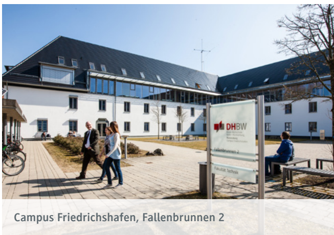
Campus Friedrichshafen, Fallenbrunnen 2