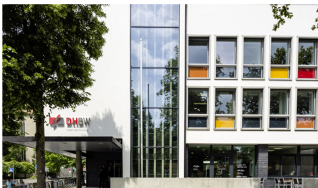
Campus Ravensburg, Marienplatz 2

Weitere Informationen zu den Master-Programmen der DHBW sowie unseren lokalen Kooperations-Mastern unter www.CAS.dhbw.de und unter www.ravensburg.dhbw.de im Bereich Studienangebot – Master-Studiengänge.