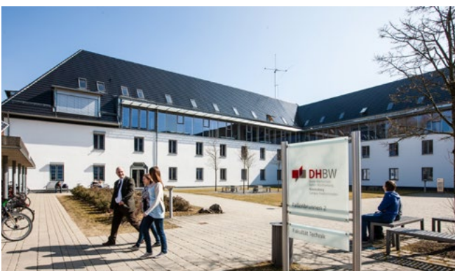
Campus Friedrichshafen, Fallenbrunnen 2