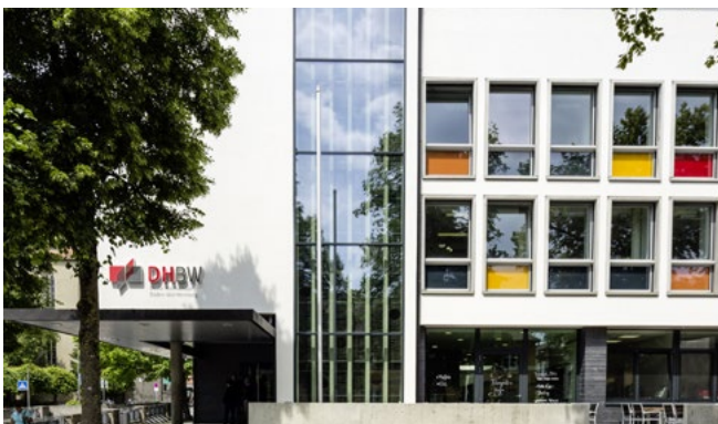
Campus Ravensburg, Marienplatz 2

Weitere Informationen zu den Master-Programme der DHBW sowie unseren lokalen Kooperations-Mastern unter www.CAS.dhbw.de und unter www.ravensburg.dhbw.de im Bereich Studienangebot – Master-Studiengänge.